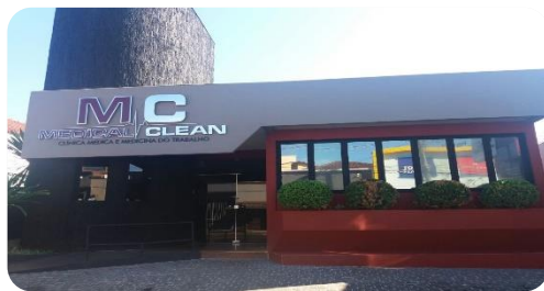
Clínica Unidade Itumbiara-GO