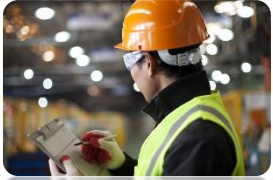
TREINAMENTO DE SEGURANÇA DO TRABALHO