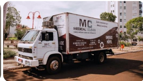
Unidade Móvel de atendimento