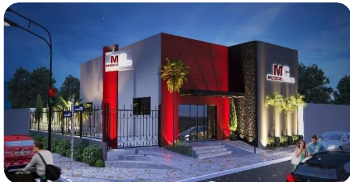
Clínica Unidade Formosa-GO